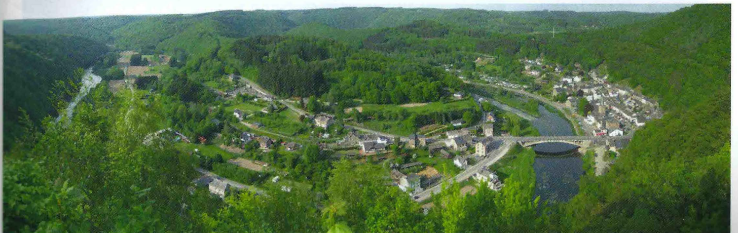
Panorama sur Bohan depuis le point de vue de la Croix