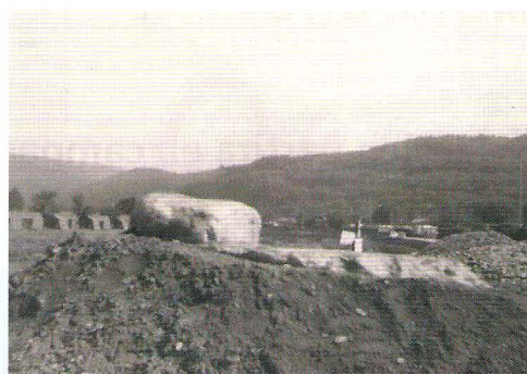
6. Pierre à marier provisoirement présentée sur un promontoire de terre.