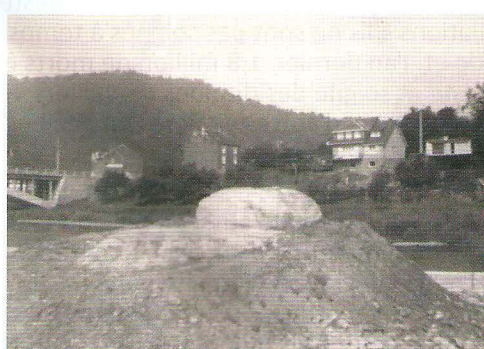
7. Idem, avec sa position par rapport au pont.