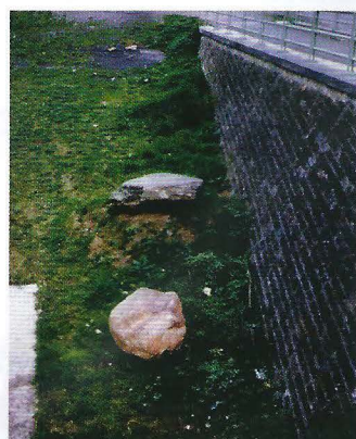
9. 1er monument à l'entrée du Chemin de la Rivette