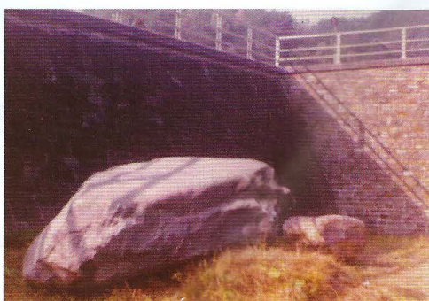
10. Pierre à marier jetée au pied du pont