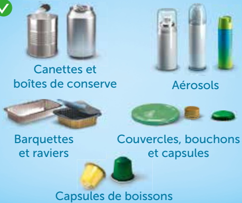
Canettes et boîtes de conserve